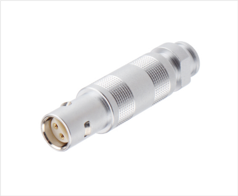
■ 电缆线夹和带护套型尾盖